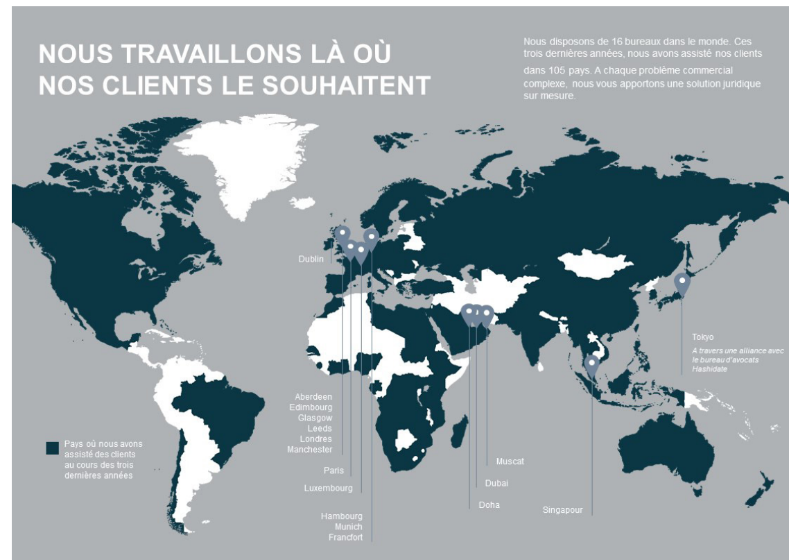
Implantations mondiales de la firme Addleshaw Goddard