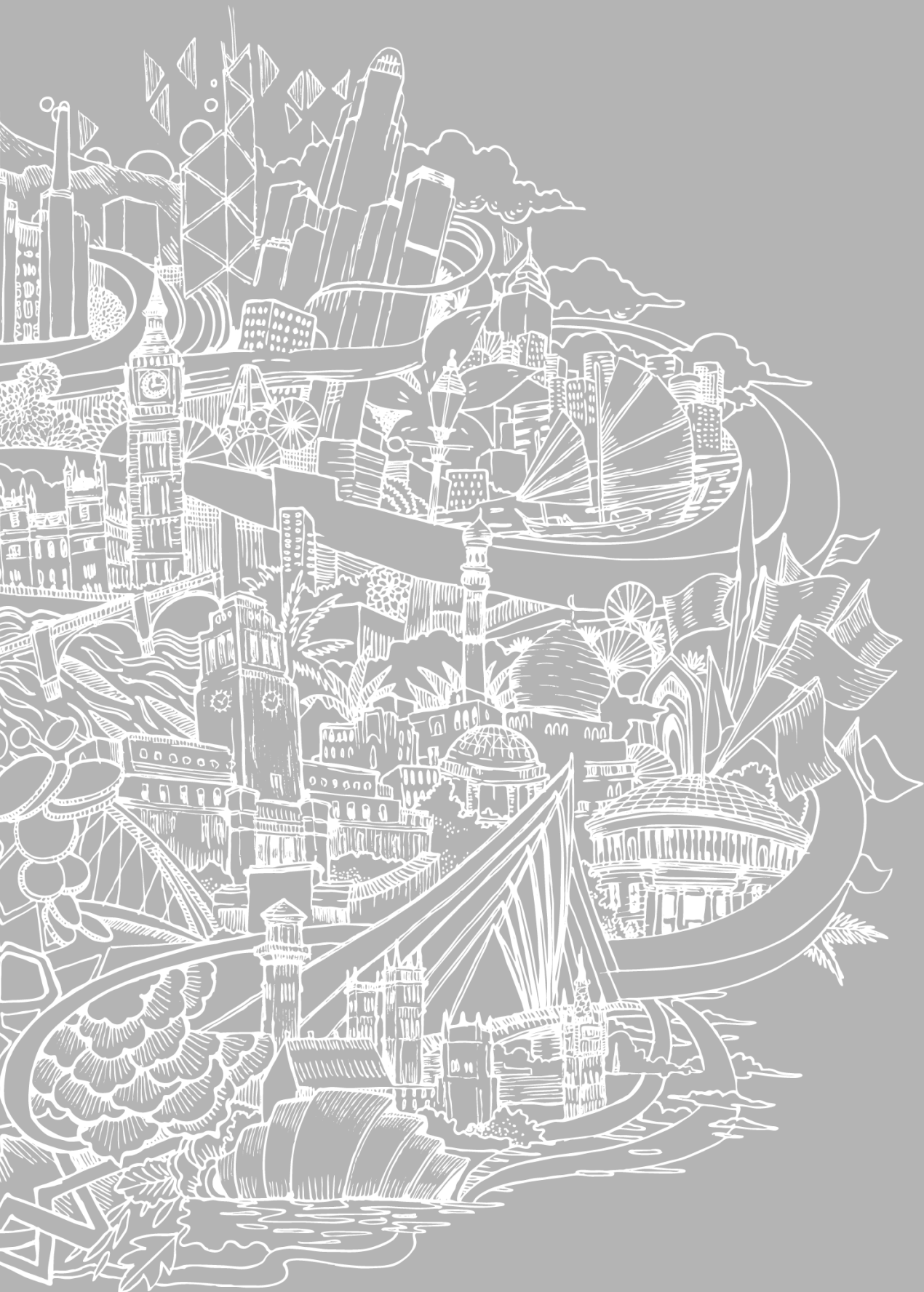
Illustration: Global Connectivity by Good Wives & Warriors